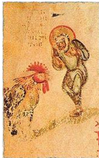
Psalter aus 9. Jhdt., byzantin.