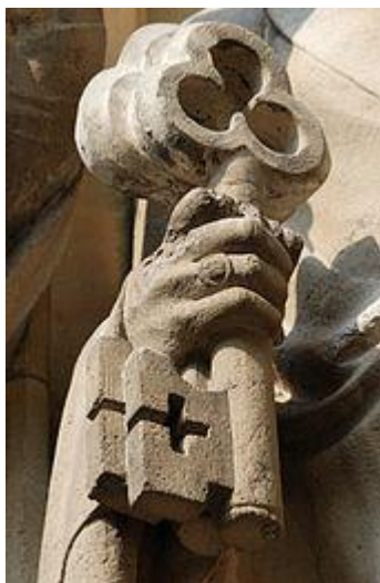
Petrus und der Schlüssel