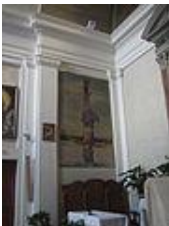
Sanctae Mariae in Palmis